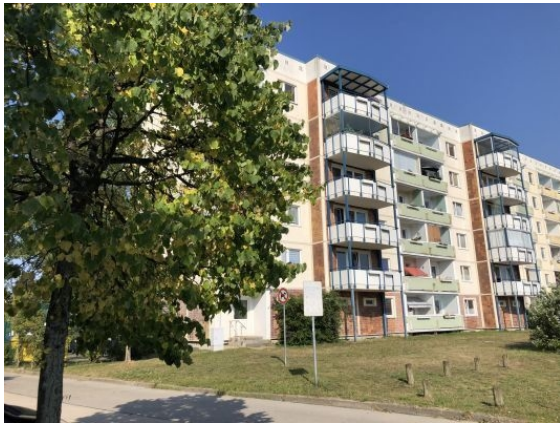
Ansicht des Objektes

Hafenbahnweg 19 in 18147 Rostock, Toitenwinkel/Gehlsdorf