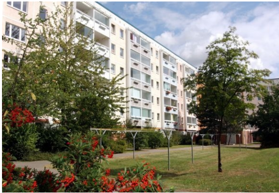
Ansicht des Objektes

Willem-Barents-Str. 6 in 18106 Rostock, Schmarl