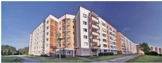
Ansicht des Objektes

Signalgastweg 15 in 18109 Rostock, Groß Klein