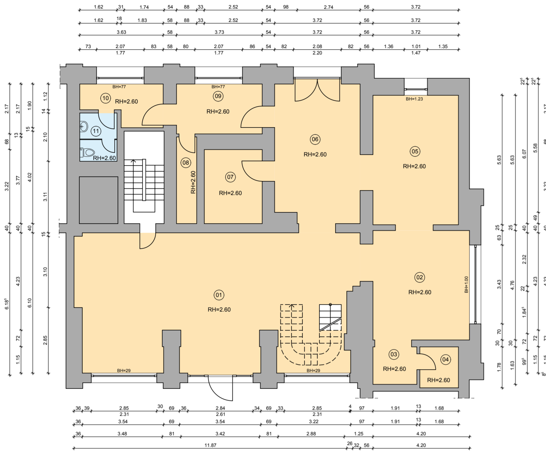
Nutz- und Grundflächen von Wirtschafts-u. Gewerberäumen